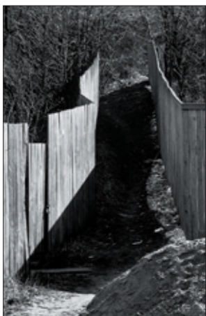
Фото 8. Светлана Афанасьева