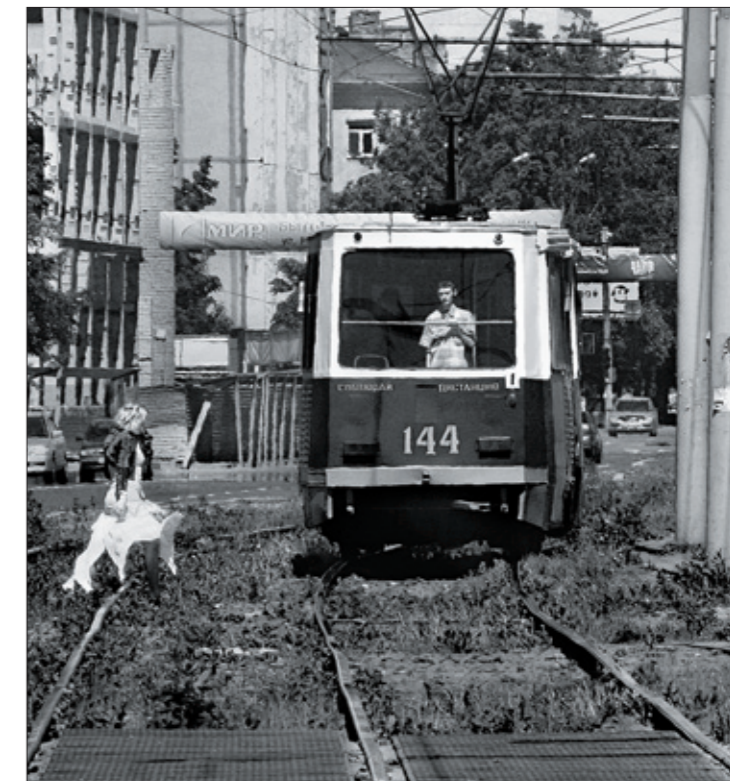
Фото 12. Светлана Афанасьева