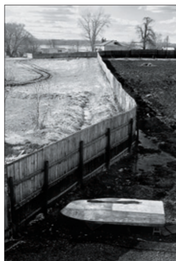
Фото 3. Светлана Афанасьева