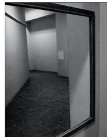
Фото 4. Светлана Афанасьева