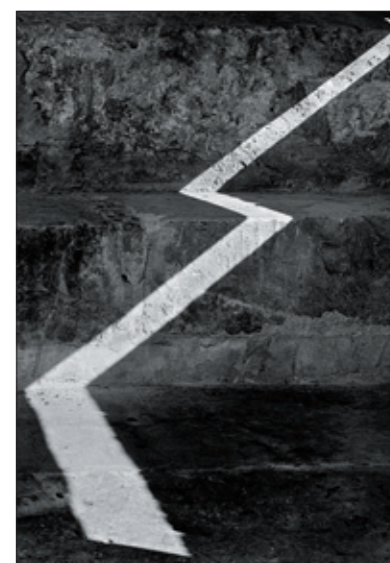
Фото 7. Светлана Афанасьева